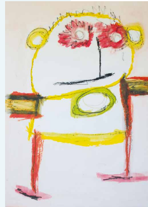
Robert Wilhelm - Grazyna - 2017 - Acrylfarbe, Tusche, Kreide, Edding