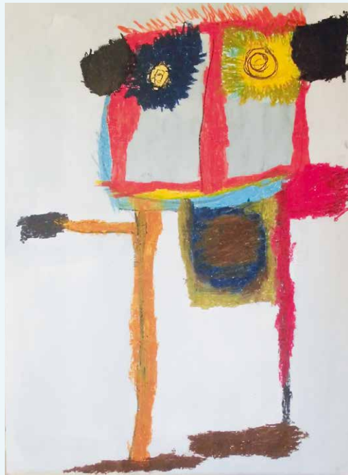
Robert Wilhelm - Josef - 2017 - Acrylfarbe, Kreide, Edding

Mo. bis Do.: 08.00 – 16.00 Uhr und Fr.: 08.00 – 13.00 Uhr