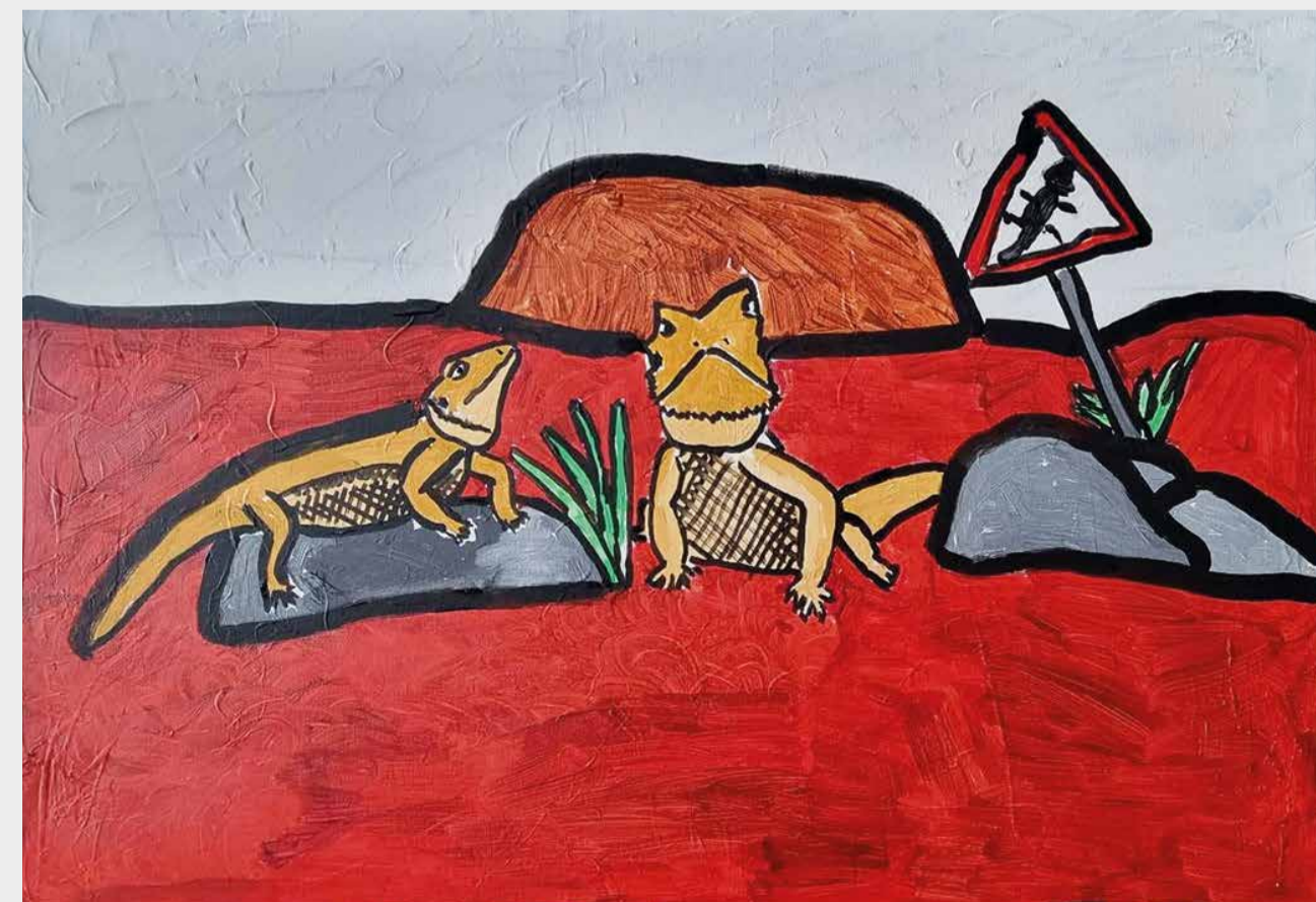
Angelina Vetter, Bartagamen-Pärchen in Australien